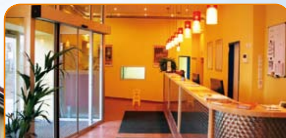
Entrance / Reception