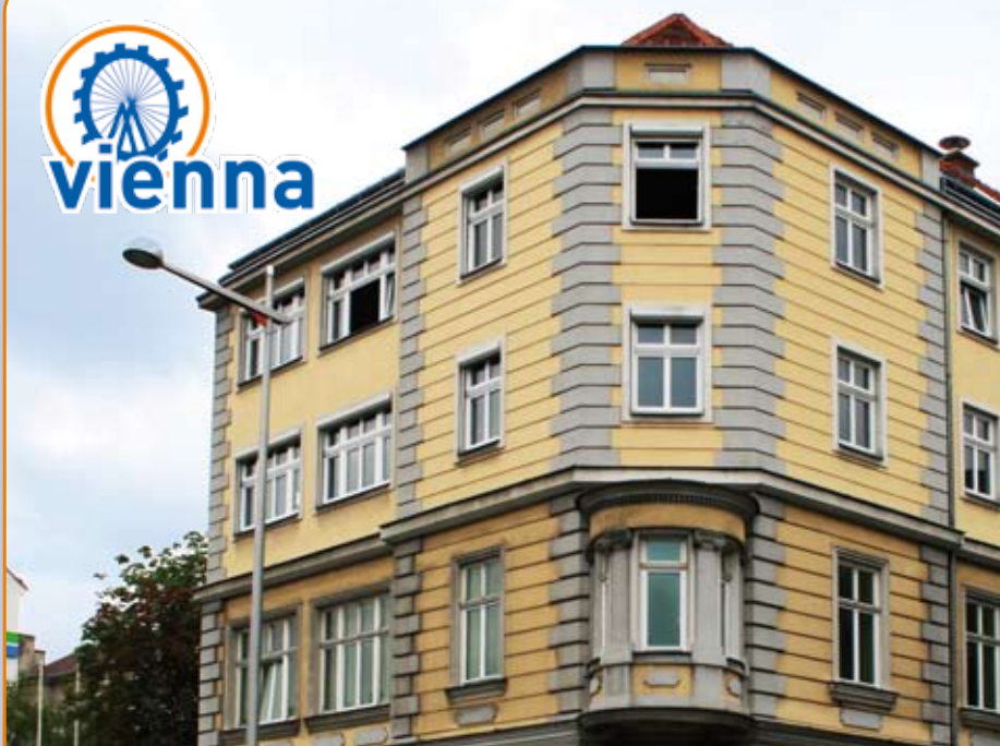
A&amp;O Vienna Stadthalle, Lerchenfelder Gürtel 9-11, AT-Vienna 1160