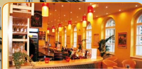
Bar / Lounge