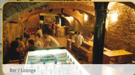
Bar / Lounge