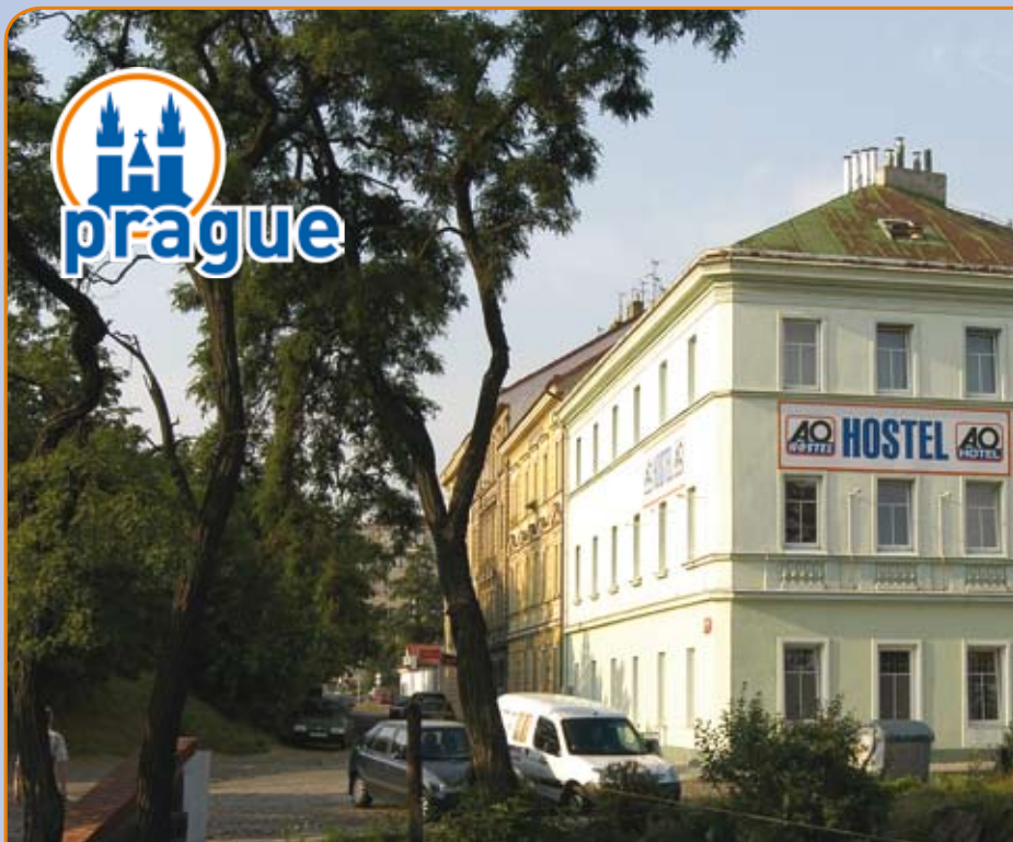
A&amp;O Prag Holesovice, U Vystaviste 1/262, CZ-17000 Prague 7