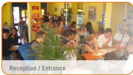
Reception / Entrance

A&O München Hackerbrücke, Arnulfstr. 102, D-80636 München