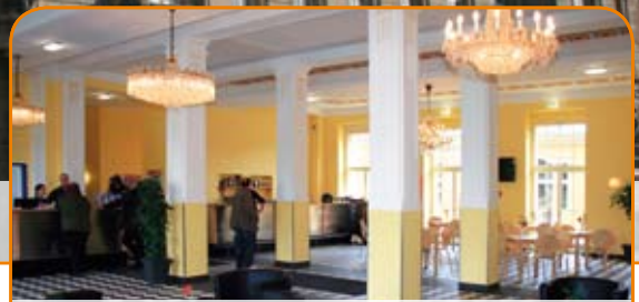
Reception / Entrance

A&O Leipzig Hauptbahnhof, Brandenburger Str. 2, D-04103 Leipzig