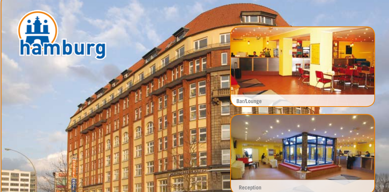
A&amp;O Hamburg Hauptbahnhof, Amsinckstr. 6-10, D-20097 Hamburg