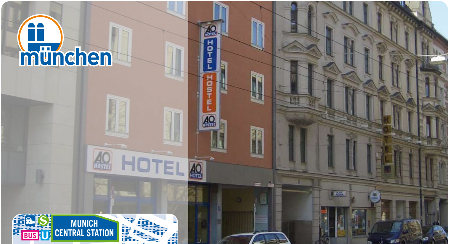
A&O München Hauptbahnhof, Bayerstr. 75, D-80335 München