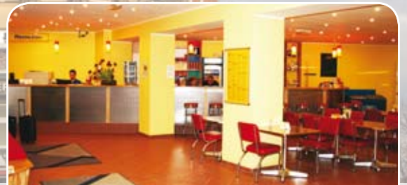
Bar / Lounge