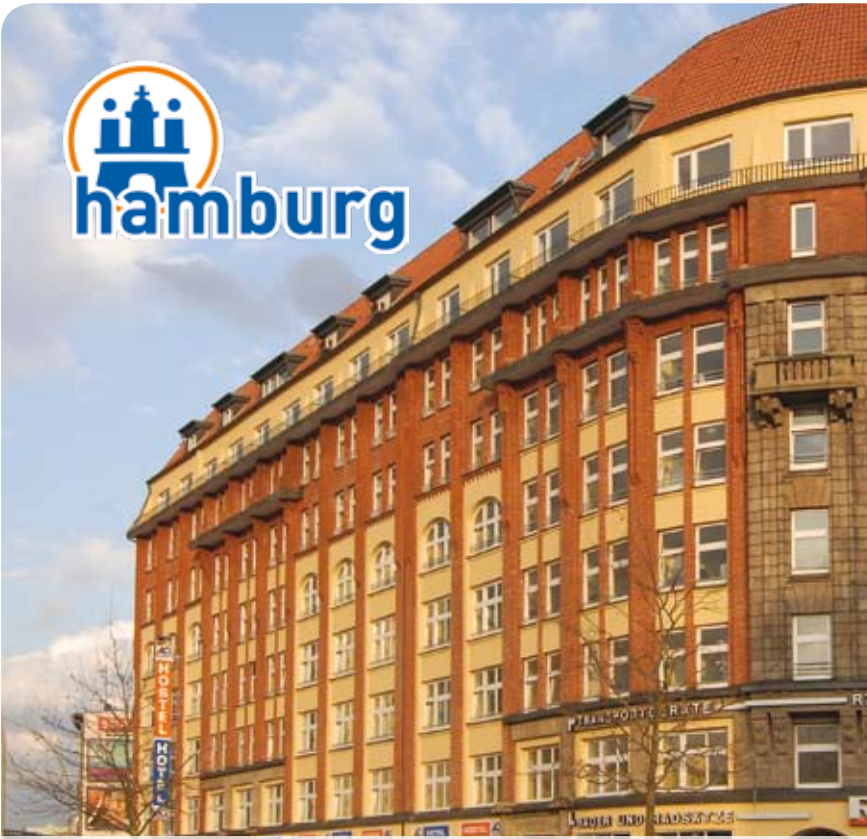
A&O Hamburg Hauptbahnhof, Amsinckstr. 2-10, D-20097 Hamburg