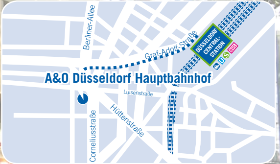
A&O Düsseldorf Hauptbahnhof, Corneliusstraße 9, D-40215 D'orf