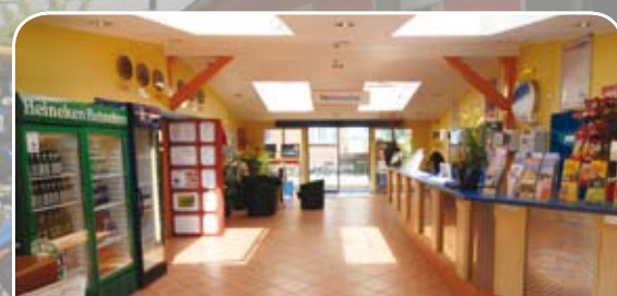
Eingangsbereich / Rezeption